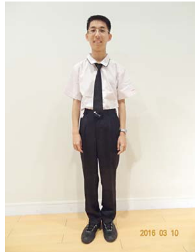
28 妝管科白色上衣 30 妝管科長褲(男) 32 妝管科領帶