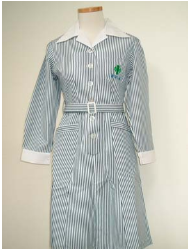
22 護理科長袖 實習服洋裝