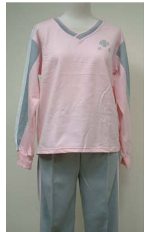
15 運動長袖上衣 11 運動長褲 (女)