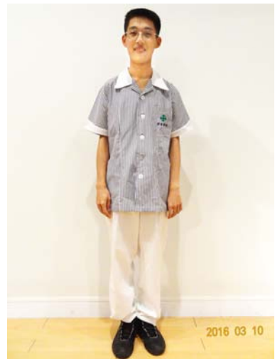
21、23 護理科實習 短(長)袖上衣 26 護理科實習長褲