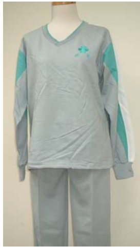
16 運動長袖上衣 12 運動長褲 (男)