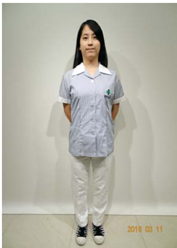
21、23 護理科實習 短(長)袖上衣 26 護理科實習長褲