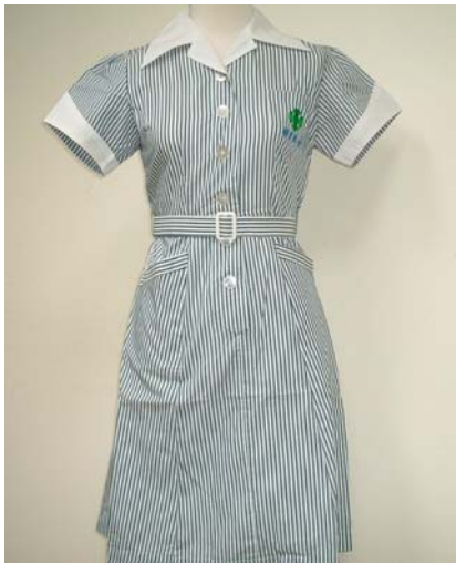
20 護理科短袖 實習服洋裝