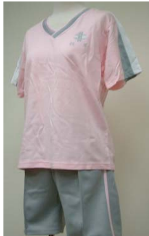
17 運動短袖上衣 13 運動短褲 (女)