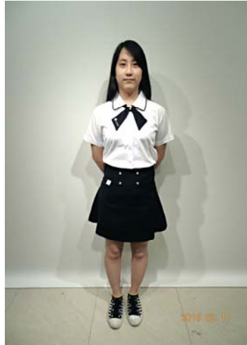
28 妝管科白色上衣 29 妝管科褲裙(女) 31 妝管科領花