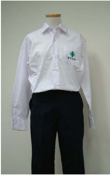
1. 2 長袖白上衣 5. 6. 7. 8 藍色長褲