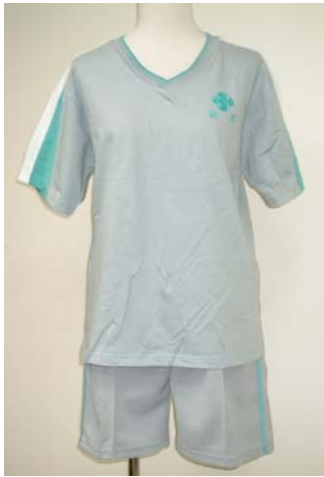
18 運動短袖上衣 14 運動短褲 (男)