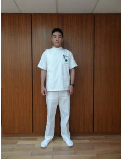
26 護理科實習長褲 上衣為藍白條紋上衣