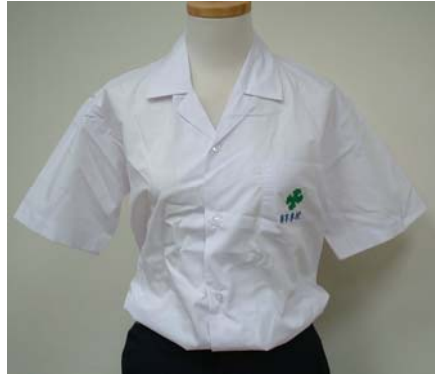
3. 4 短袖白上衣