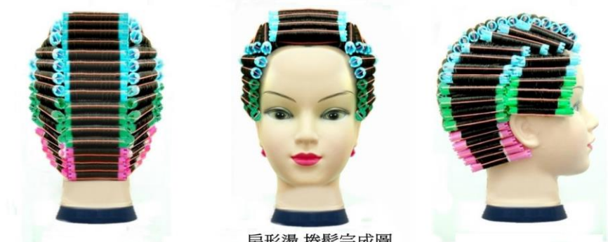
扇形燙 捲髮完成圖